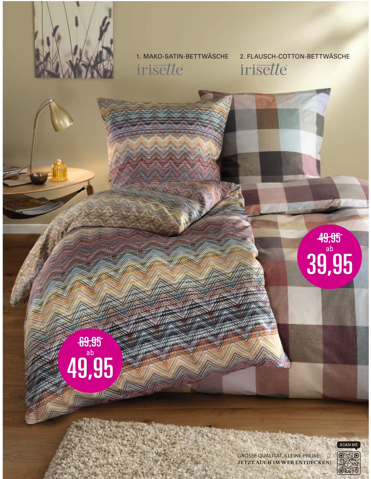
1. MAKO-SATIN-BETTWÄSCHE irissette