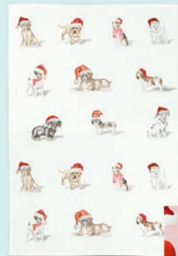
3. GESCHIRRTÜCHER je 6,95