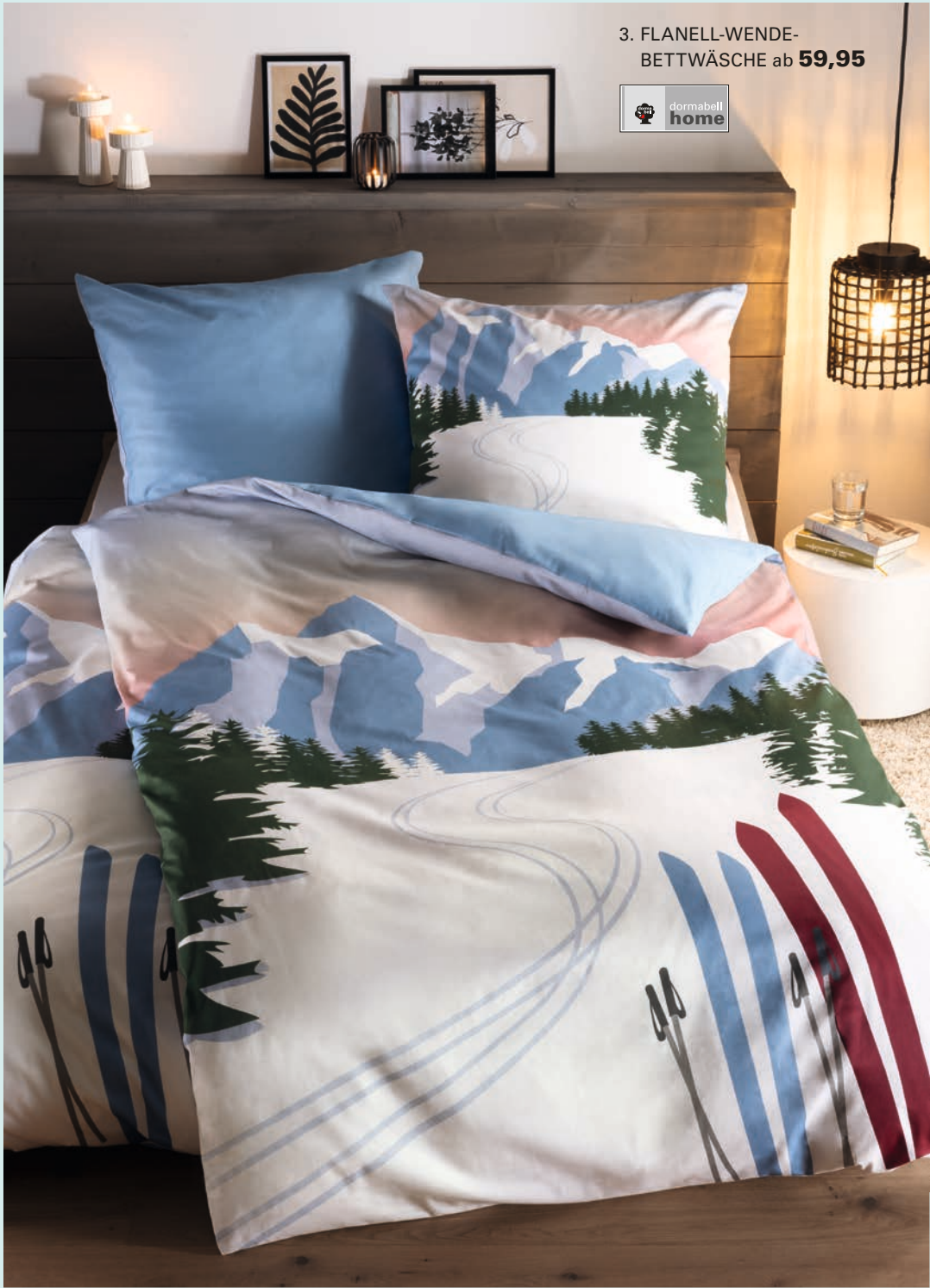
3. FLANELL-WENDE- BETTWÄSCHE ab 59,95

1. FLANELL-BETTWÄSCHE: Diese Bettwäsche verwöhnt im Schlaf – mit ausdrucksstarkem Dessin, einem harmonischen Farbspiel in sanften Blau- und Rosétönen und weicher, wärmender Flanell-Qualität. Aus 100 % Baumwolle. Mit Reißverschluss. 135 / 200 cm 69,95, 155 / 220 cm 89,95. 2. NACKENSTÜTZKISSEN DORMABELL CERVICAL: Softiges, zweiteiliges Latexkissen zur perfekten Druckverteilung. Mit atmungsaktivem Bezugstoff, durch Reißverschluss abnehmbar und bei 60 °C waschbar. Preisbeispiel: NB 4 139,95. 3. FLANELL-WENDE-BETTWÄSCHE: Ein winterliches Sehnsuchtsmotiv im Retro-Stil auf der Vorderseite, die Rückseite in Uni-Blau. Wunderbar kuschelig durch weichen, anschmiegsamen Flanell. Aus 100 % Baumwolle. Mit Reißverschluss. 135 / 200 cm 59,95, 155 / 220 cm 69,95.