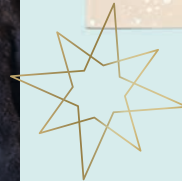
4. KUSCHELSOCKEN je 13,95