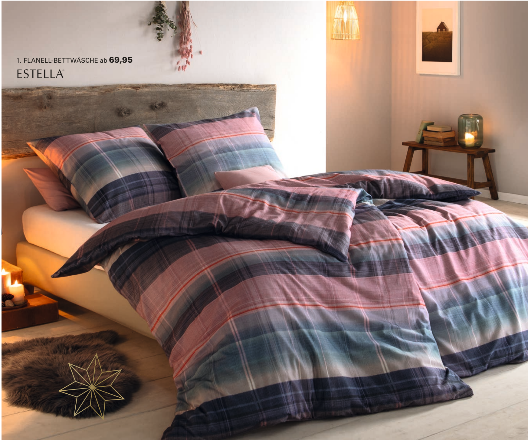
1. FLANELL-BETTWÄSCHE ab 69,95 ESTELLA