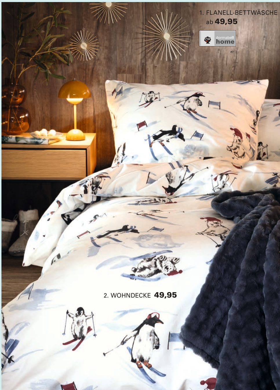
1. FLANELL-BETTWÄSCHE ab 49,95